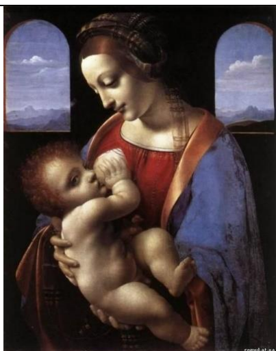
Леонардо да Винчи

https://drive.google.com/file/d/1W7Ph_nxi20sfsAwIM7m6_E36FU5kcDp/view?usp=sharing